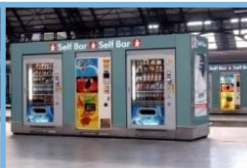
Dispensador de Productos