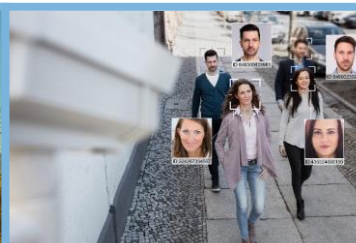
Oficinas y Instalaciones