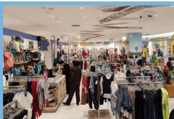
Presencia de Clientes

Estimación y visualización en colores falsos en la imagen y en un mapa de las zonas con mayor o menor presencia de personas dentro de un marco de tiempo definido dentro de áreas virtuales