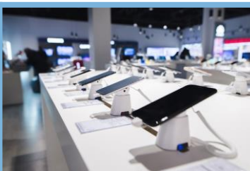
Inteligencia de Negocios