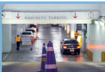
Control de Parqueaderos

Detección, lectura automática en tiempo real y notificación de placas de vehículos para la gestión del control de acceso.