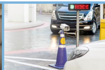
Vigilancia de Acceso