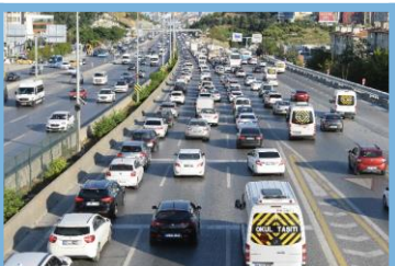
Cuellos de Botella