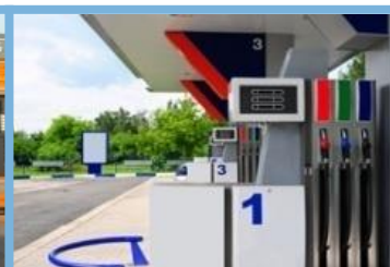
Postos de Combustíveis