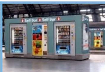
Dispensador de Produtos