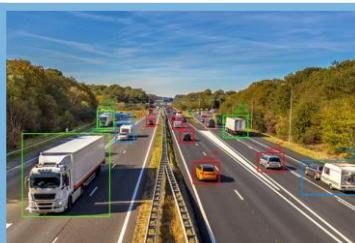
Estradas e Rodovias

Estimativa e registro da velocidade média de veículos ou objetos de interesse e notificação se a velocidade média for maior ou menor que um limite definido