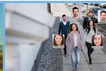
Escritórios e Instalações