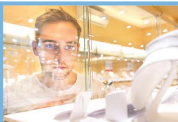
Presença de Face

Detecção e notificação da presença de rostos humanos em áreas virtuais e, para cada rosto detectado, registro de seu tempo de permanência