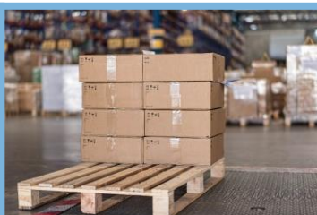
Controle de Inventário